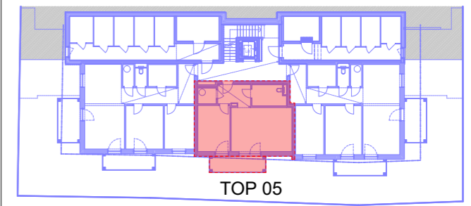
ÜBERSICHT 1.OBERGESCHOSS 1/500